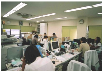
←质量管理·消费者对应中心