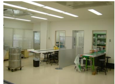
清洁宽大的作业车间→