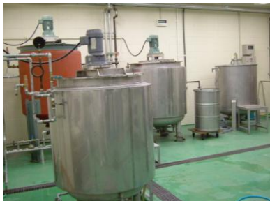
←液体产品制造室一角