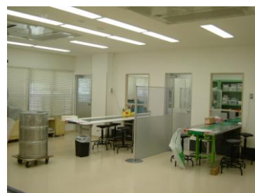
清洁宽大的作业车间→